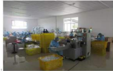
•Description: Production Lines