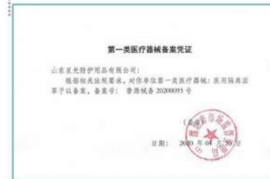
•Description: Medical Device Registration