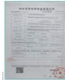
•Description: Export License