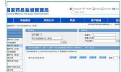
•Description: Medical Device Registration