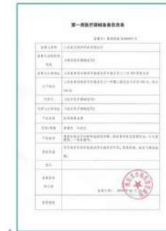
•Description: Medical Device Registration