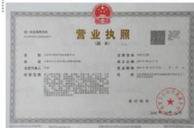
•Description: Business License